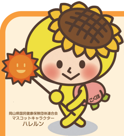
岡山県国民健康保険団体連合会 マスコットキャラクター ハレルン