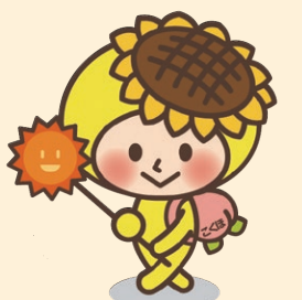
岡山県内市町村・岡山県国民健康保険団体連合会 マスコットキャラクター「ナマケルン」